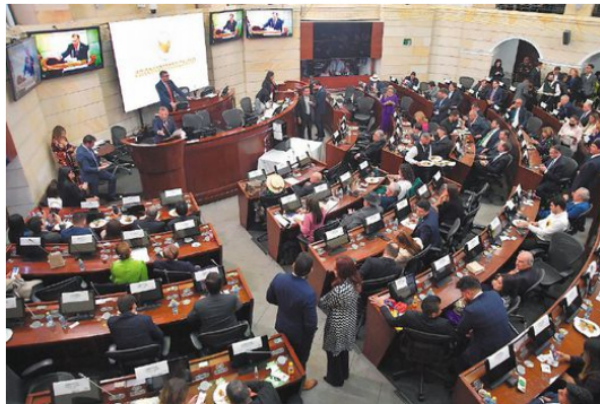
Instalación Senado de la República 2022-2026 elección Roy Barreras presidente Senado