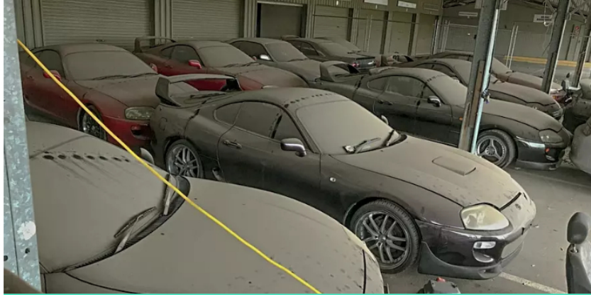
Bogotá: coches 2021 no vendidos ahora casi regalados: ver precios