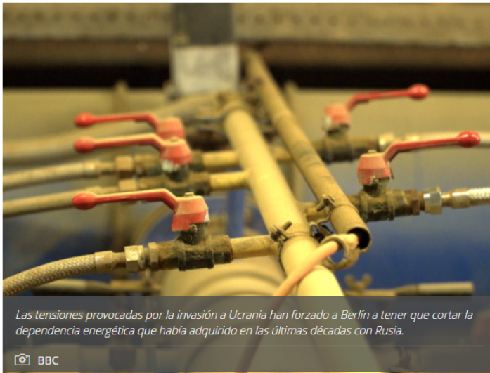
Las tensiones provocadas por la invasión a Ucrania han forzado a Berlín a tener que cortar la dependencia energética que había adquirido en las últimas décadas con Rusia.

Recurrir a otros productores de hidrocarburos del Norte de Europa, África y Medio Oriente y construir nuevas instalaciones son algunas de las medidas.