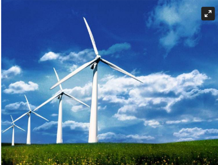
Huila uno de los departamentos piloto en producir energía eólica

El centro poblado de San Francisco y Neiva, serán los sitios donde se implementara el programa.