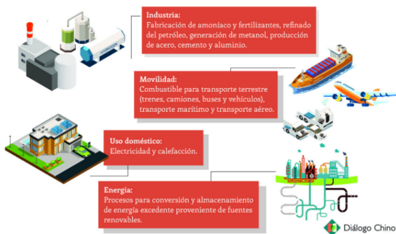
Gráfico: Facundo Da Roza / Diálogo Chino

“El hidrógeno verde es nuestra mejor opción para acelerar la transición energética”, enfatizó de la Cruz. Hoy Chile, que cuenta con 68 % de su matriz energética en base a combustibles fósiles, es quien lidera en la región en materia de H2V, con una estrategia nacional con metas muy específicas, como ser el país de la región con el hidrógeno verde más barato del planeta (menor a los 1,5 dólares/Kg al año 2030).