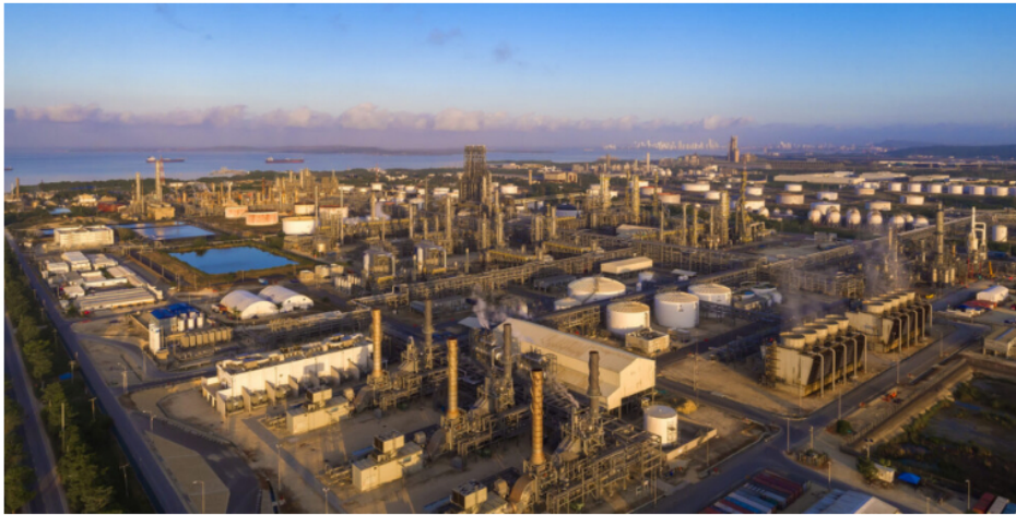
Refinería de petróleo de Ecopetrol en Cartagena, Colombia, donde la empresa comenzó en marzo pasado un proyecto piloto de producción de hidrógeno verde.

MONTEVIDEO – Aprovechando su potencial para la producción de energías renovables, principalmente solar y eólica, los países de América Latina comienzan a dar sus primeros pasos en la floreciente industria global del hidrógeno verde (H2V), con la cual esperan tomar acciones que les permitan llegar a ser carbono neutrales para mitad de siglo.