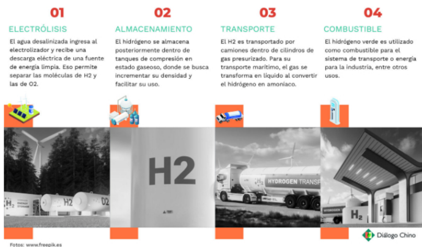
Gráfico: Facundo Da Roza / Diálogo Chino

El objetivo de Uruguay es comenzar a producir H 2 V en 2025, según consta en su hoja de ruta . En ese sentido, Paganini sostuvo que el país cuenta con “ventajas comparativas” que le permitirán posicionarse como “proveedor de combustibles alternativos verdes” ante los nuevos mercados, como su ya desarrollado sector de energías renovables. El país genera 98% de su electricidad de fuentes renovables.