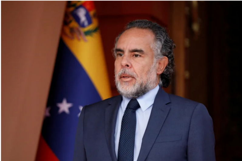
Embajador de Colombia en Venezuela Armando Benedetti.

Desde Caracas Armando Benedetti, Embajador de Colombia en Venezuela, indicó en entrevista a la prensa de la capital bolivariana que sí le nombraran cónsules podría agilizar su desempeño diplomático además de eximirse de obligaciones extras a las cuales se ha hecho acreedor por la ausencia de personal.