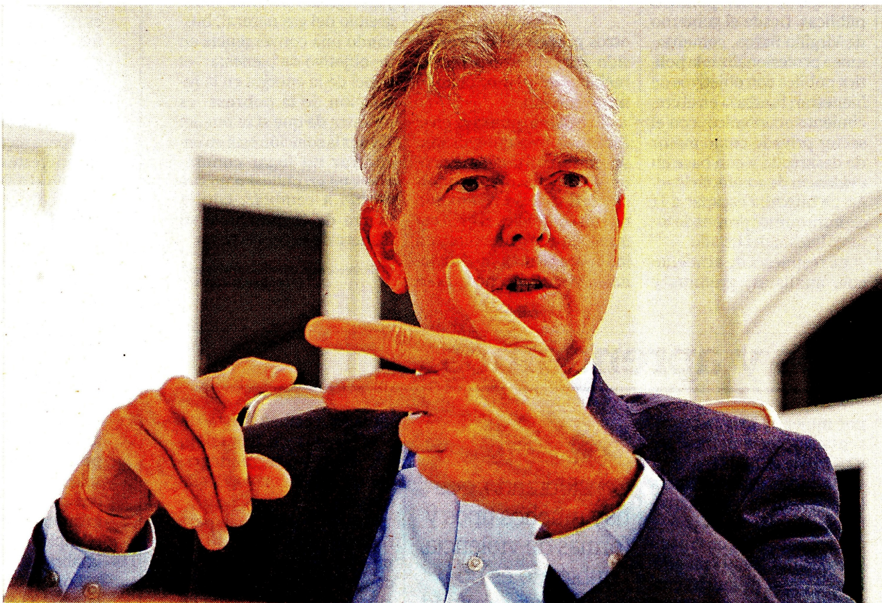
El embajador del Reino de Países Bajos, Ernst Noorman, aseguró que el proceso de paz apoyó el interés sobre el país. CEET.

El embajador del país europeo, Ernst Noorman, señaló que debe protegerse el empleo de los sectores tradicionales. Paz y economía circular serán ejes claves.