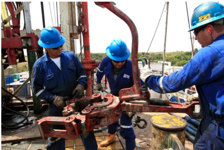
Foto de archivo. Empleados trabajan junto a las tuberías de excavación de petróleo en el campo Rubiales, en el departamento del Meta, Colombia. 23 de enero, 2013. REUTERS/José Miguel Gómez

“Con el fin dar garantía a las actividades exploratorias comprometidas en los mismos, así como, el aporte que pueden brindar los contratos de hidrocarburos que ya están en fase de desarrollo y producción”, agregó la ministra Vélez.