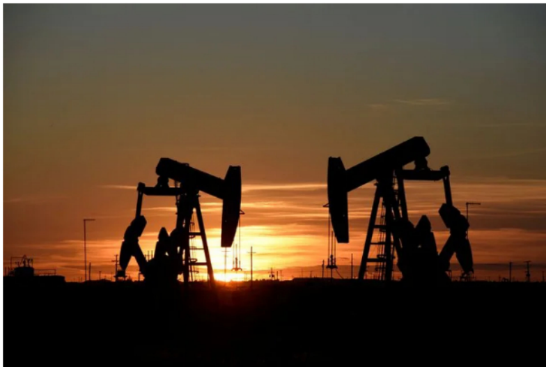
FOTO DE ARCHIVO: Gobierno estudiaría los contratos petroleros, permitiendo saber si habrá más adjudicaciones o no.