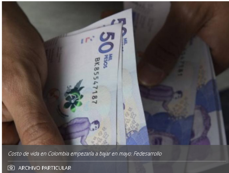
Costo de vida en Colombia empezaría a bajar en mayo: Fedesarrollo

La entidad hizo públicas sus previsiones económicas para el país con respecto a diferentes temas como petróleo , dólar y el crecimiento económico.