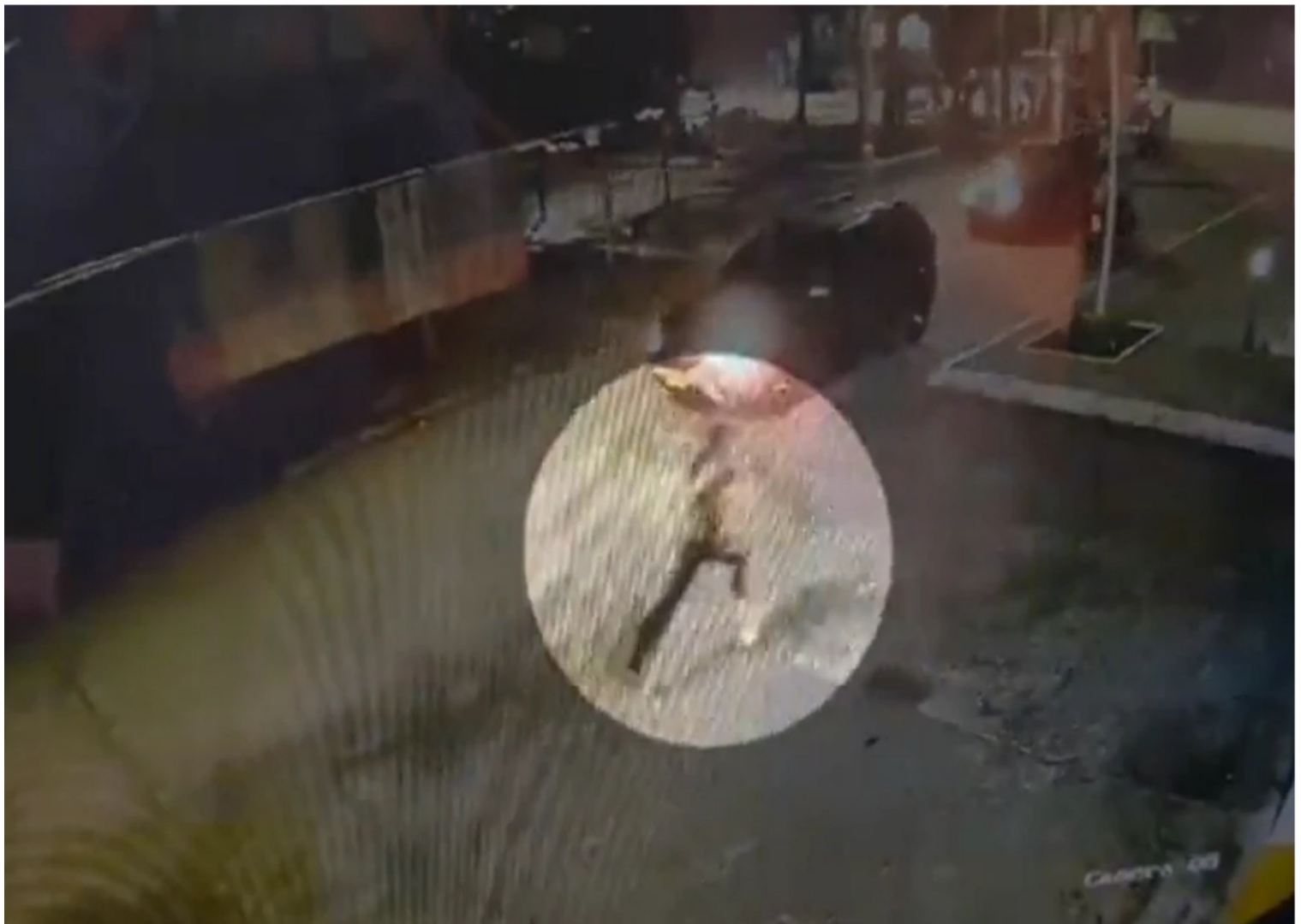
Capturado por atentado en Santander.

Durante noviembre dos empresas petroleras han sido atacadas con artefactos explosivos en Santander.