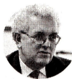
José Antonio Ocampo Ministro de Hacienda

“Reemplazar 40% de nuestras exportaciones por nuevos productos, no se hace de un día para otro, sobre todo en una economía mundial que no muestra gran dinamismo”.