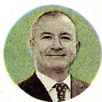
RAFAEL GUZMÁN Presidente Hocol

“Estamos entendiendo la reforma. Obviamente la inversión depende de la caja disponible”.