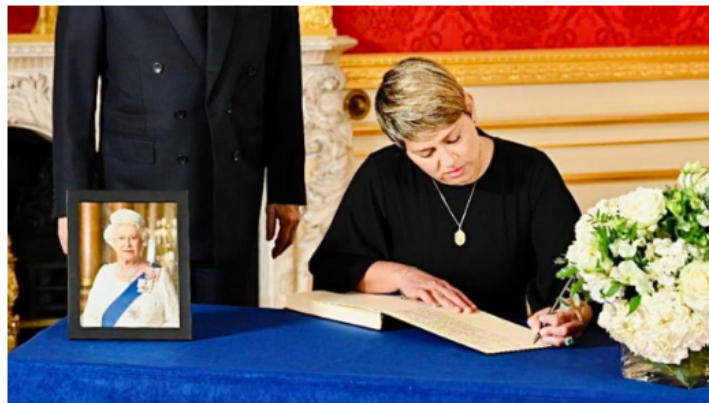
Verónica Alcocer ha jugado un papel internacional en el arranque del gobierno de su esposo, Gustavo Petro.