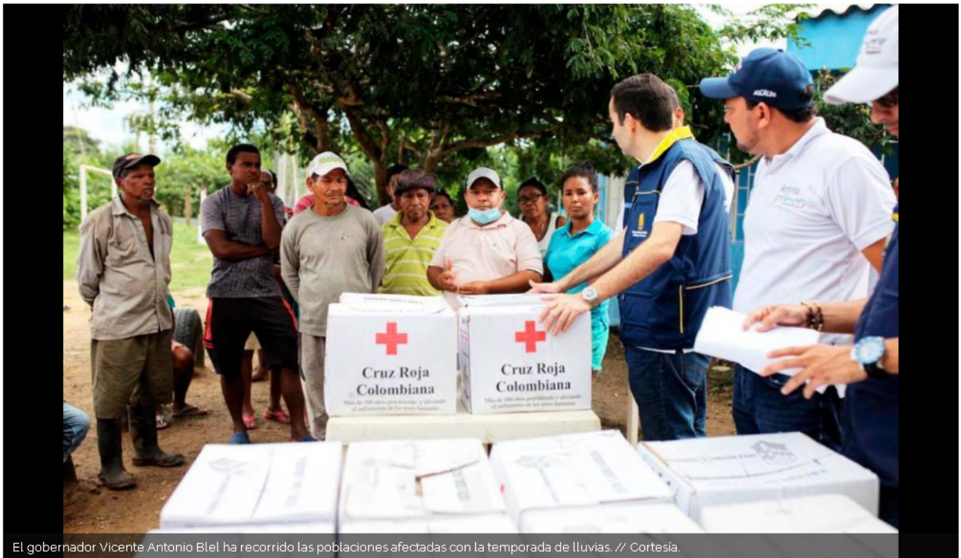
El gobernador Vicente Antonio Blés ha recorrido las poblaciones afectadas con la temporada de lluvias.

Los interesados en solidarizarse con las familias bolivarenses, afectadas por la temporada de lluvias, tienen oportunidad hasta hoy para donar.