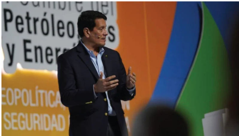
El presidente de la petrolera estatal señaló que el reto es traer el gas a la superficie.