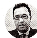
Alfonso Prada Ministro del Interior

"No hay una intromisión en la independencia o autonomía del Banco de la República, solo buscamos una reflexión sobre decisiones en la política económica".