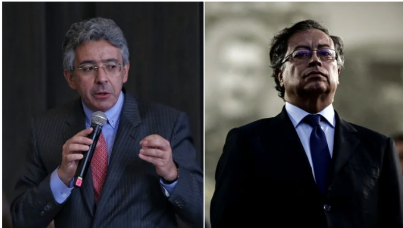
El excandidato presidencial criticó y arremetió en contra del jefe de Estado.

... y para el control de precios, y para romper la independencia del Banco de la República, y para sacar corriendo a las petroleras, reventar a Ecopetrol , frenar las inversiones del sector productivo, inducir la crisis financiera de las EPS, liberar, indultar y contratar a los jefes y sargentos de la primera línea y masificar la toma de tierras.