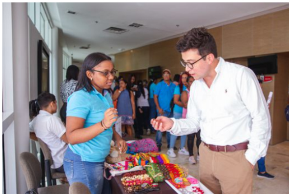
Los beneficiarios reciben asesoría empresarial personalizada, entrega de soluciones a través de bienes como maquinaria, herramientas y equipos de cómputo.