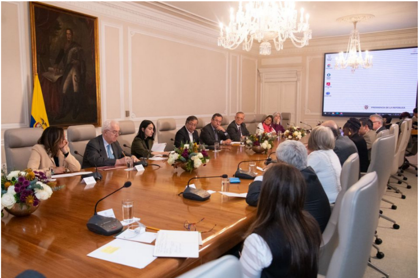
Imagen de archivo de una parte del Gabinete Petro, durante uno de sus primeros consejos de ministros.