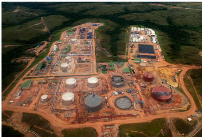
Los procesos de extracción que se han realizado desde hace más de 100 años han permitido sacar aproximadamente 11.000 millones de barriles.

Las reservas que pueden ser extraídas suman alrededor de 2.000 millones de barriles, y a los ritmos de extracción actual, de 750.000 barriles por día, estas le permitirían al país disponer de 7,3 años de abastecimiento, aproximadamente.