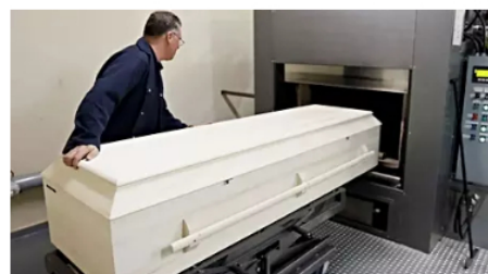
El costo de la cremación en Caicá podría