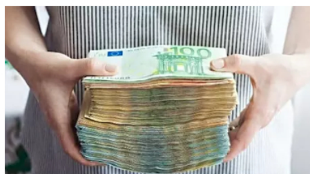
CFD: Así se genera un segundo ingreso con una

Vuelve la gran exposición de carros usados