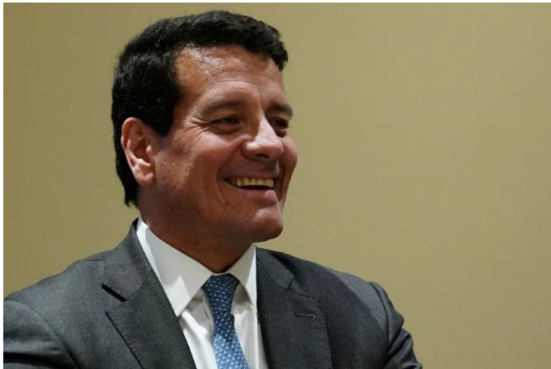
Foto de archivo. Estados Unidos, 2 de marzo, 2020.