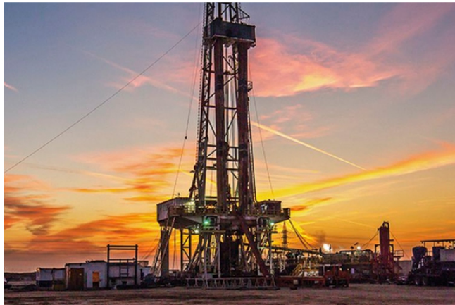
Buscan suspender proyectos de fracking en el país - Google

Hace exactamente dos meses Ecopetrol le pidió a la Agencia Nacional de Hidrocarburos, ANH, una suspensión de 90 días en los contratos de los pilotos de fracking, debido a la oposición del nuevo Gobierno a la práctica de extracción con esta técnica.