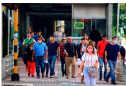
Bucaramanga es la segunda ciudad de las grandes de Colombia con menor confianza en sus consumidores

Enfatizó en que desde Ecopetrol se mantienen en la decisión de pedir la suspensión, es decir, "pisamos el freno con los no convencionales. Si el Gobierno y el Congreso toman la decisión de que no se hagan en el país, Ecopetrol no va a hacer no convencionales".