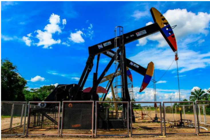
Los dos proyectos contemplan la realización de operaciones en Puerto Wilches (Santander). Estos contratos buscan adelantar la técnica 'fracking' para encontrar información científica, social, ambiental, técnica y operacional que después le puede servir al Estado para desarrollar la política de yacimientos no convencionales.

Sin embargo, El presidente de Ecopetrol , Felipe Bayón, precisó que seguirán con la actividad de fracturamiento o 'fracking' en los proyectos que ya tiene en marcha en la cuenca del Permian, en Estados Unidos.