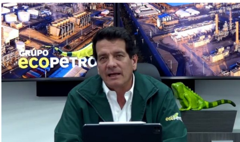
Felipe Bayón, presidente de Ecopetrol .