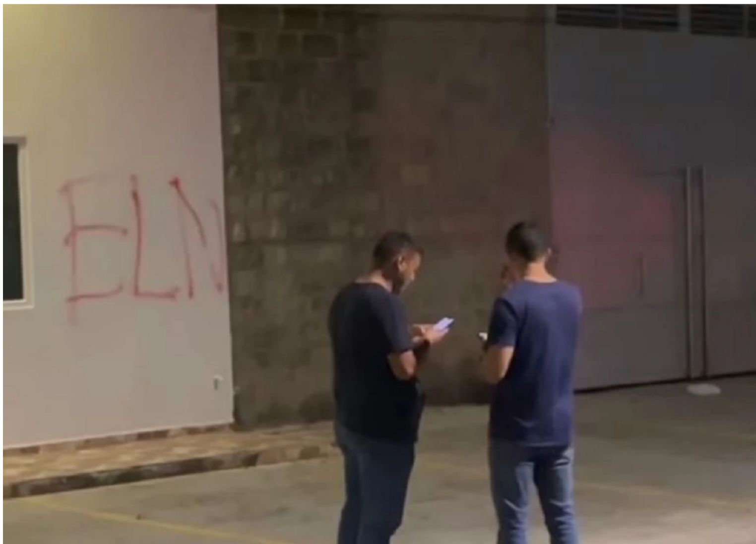
Artefacto explosivo en Barrancabermeja ELN Suministrada

En la fachada de la empresa petrolera aparecieron marcadas las siglas ELN. La Policía avanza en las investigaciones para determinar los responsables del hecho.