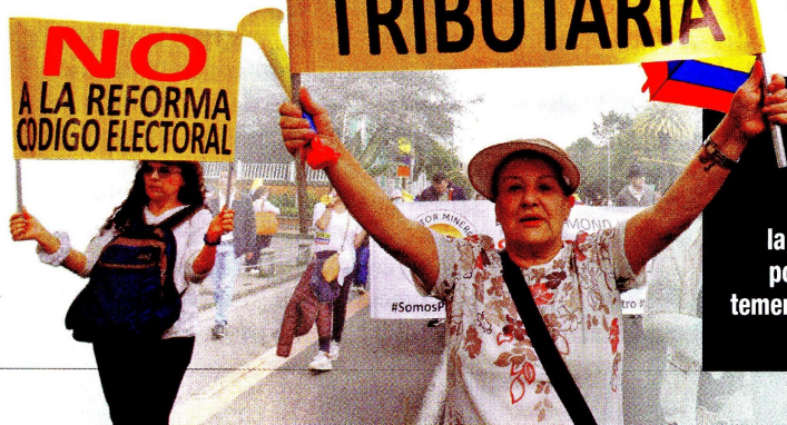
◀ Varias manifestaciones se realizaron antes del trámite de la tributaria, motivadas por ciudadanos que les temen a los impactos de la iniciativa.

En otros escenarios de entretenimiento también habrá efecto. En la reforma aprobada quedaron gravados los espectáculos taurinos, que no tenían IVA, y ahora estarán obligados a pagar el 19 por ciento. Si