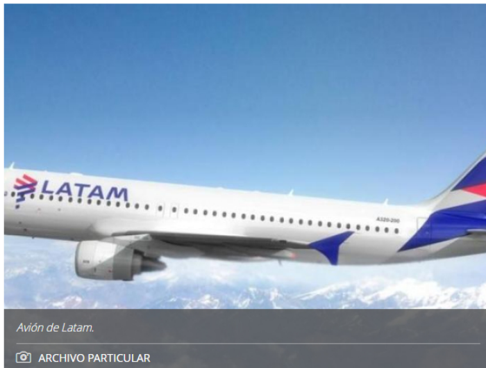
Avión de Latam.

A octubre de 2022 la red del grupo alcanzó los 144 destinos en 22 países y espera cerrar el año con una operación global mayor.