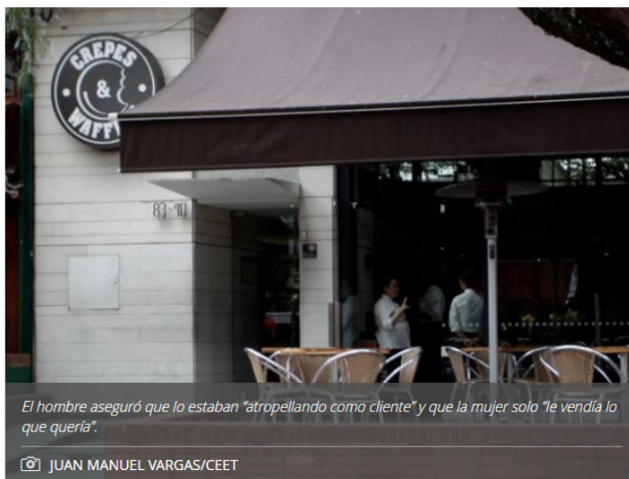
El hombre aseguró que lo estaban "atropellando como cliente" y que la mujer solo "le vendía lo que quería".

Este fue el resultado del Panel de opinión 2022 que realizó Cifras y Conceptos con la participación de 1.431 líderes del país.