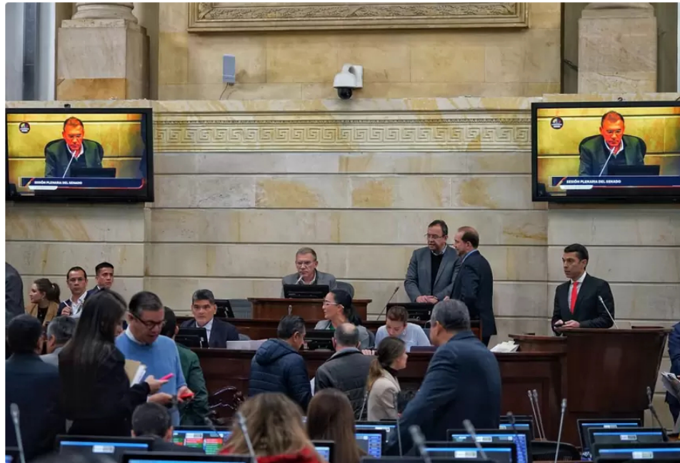
Senado de la República - plenaria.