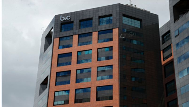
La Bolsa de Valores de Colombia se encamina a terminar bien su última sesión de la semana. Bogotá octubre 9 del 2020.

Luego de dos días seguidos de fuertes caídas esta semana, la Bolsa de Valores de Colombia y Ecopetrol comenzaron el día disparados al alza, aprovechando el momento de tranquilidad que se vive en los mercados, luego de las cifras de desempleo que se revelaron Estados Unidos, que alimentaron la perspectiva de un posible enfriamiento de la economía, tal y como se viene esperando de la Reserva Federal.