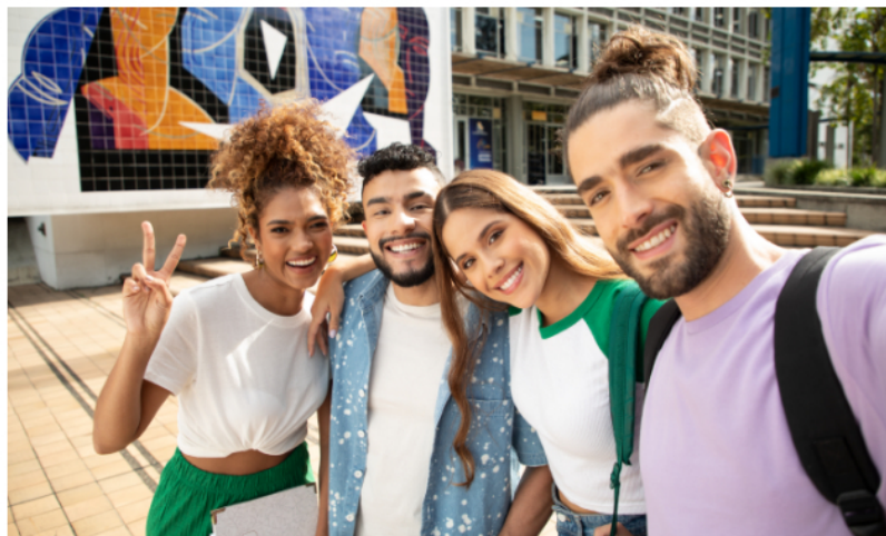
La UPB cuenta con 12 Doctorados, 74 Maestrías, 27 Especializaciones Médico Quirúrgicas y 105 Especializaciones en sus distintas sedes en Colombia.

Gracias a los estudios se pueden hacer contactos, desarrollar autonomía y pensamiento crítico.