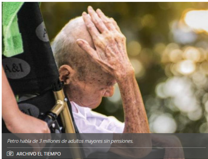
Petro habla de 3 millones de adultos mayores sin pensiones.

Fondo soberano de Asofondos y portafolio de renovables, entre las nuevas propuestas.