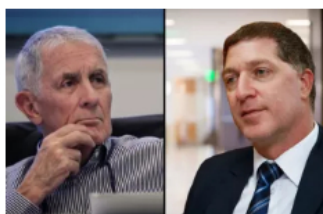
Economía Oct 28