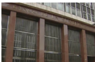
Economía Oct 28