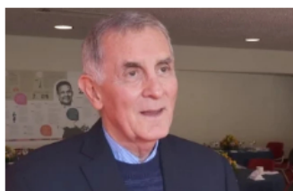
Economía Oct 28