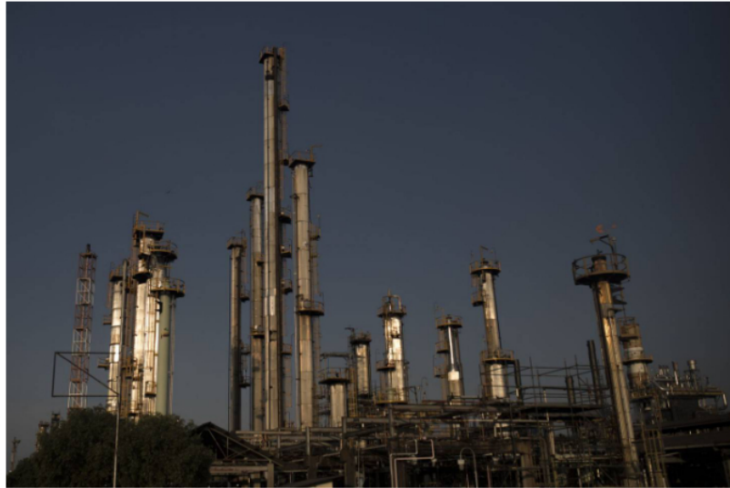
Ecopetrol La refinera de Ecopetrol Barrancabermeja en Barrancabermeja, Colombia, el martes 15 de febrero de 2022.

■ En un pronunciamiento sobre la reforma tributaria pidió garantizar que no se suspenda la actividad de exploración