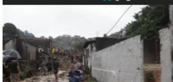
Video: Inundaciones en Brasil ya dejan 91 muertos