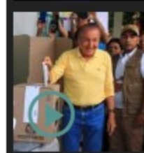
Video: "No vamos a hacer alianzas", Rodolfo se planta como independiente para segunda vuelta