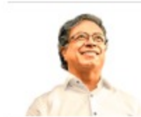
El cambio por la vida de Gustavo Petro Urrego

Asegura que "una sociedad en la que el hambre es producto de la corrupción, de funcionarios incompetentes, de contratistas que exprimen los recursos públicos, la violencia siempre será un riesgo latente".