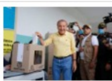
Rodolfo Hernández 'barrió' en Santander y Bucaramanga

Asegura que "le quitará la chequera" a los corruptos para que los recursos sean manejados limpiamente sean invertidos en las necesidades del país.