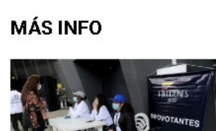
Elecciones en Colombia