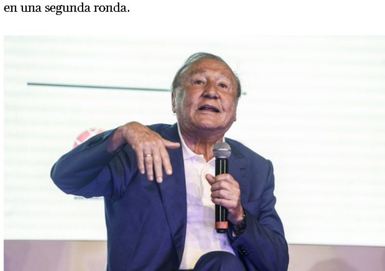
rodolfo hernandez