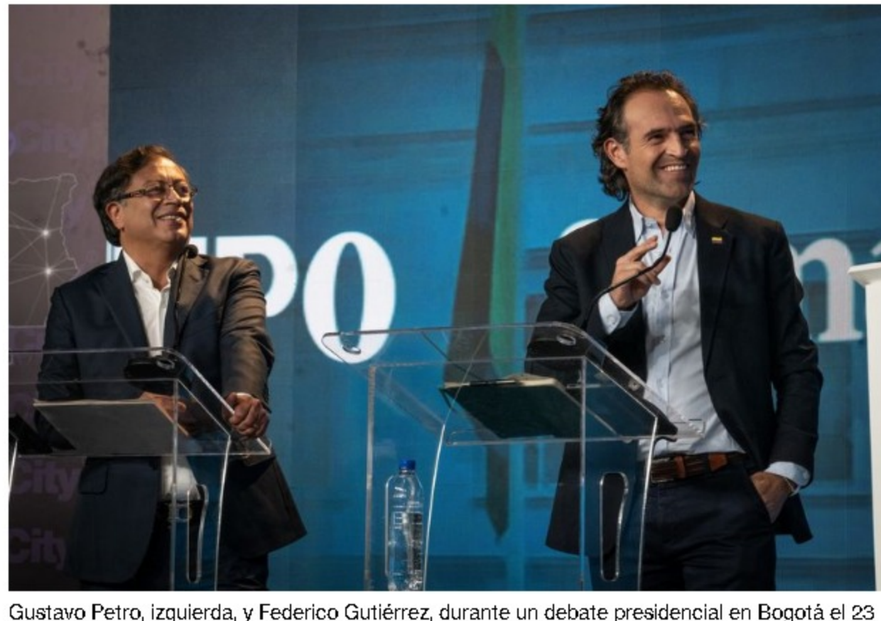
Gustavo Petro, izquierda, y Federico Gutiérrez, durante un debate presidencial en Bogotá el 23 de mayo.