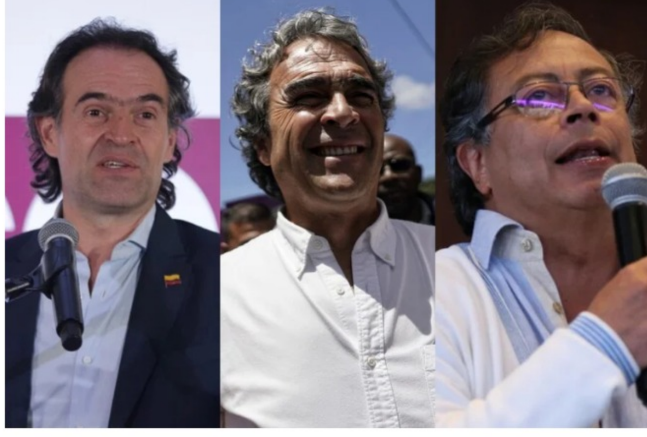
Federico Gutiérrez, Sergio Fajardo, Gustavo Petro

En la mañana de este jueves 26 de mayo los candidatos presidenciales Gustavo Petro, Sergio Fajardo y Federico Gutiérrez se encontraron en un nuevo debate presidencial previo a la primera vuelta de las elecciones presidenciales que se llevarán a cabo el domingo 29 de mayo.