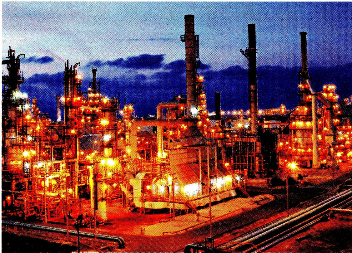
En Reficar inicia la apuesta de Ecopetrol por el hidrógeno como energético.