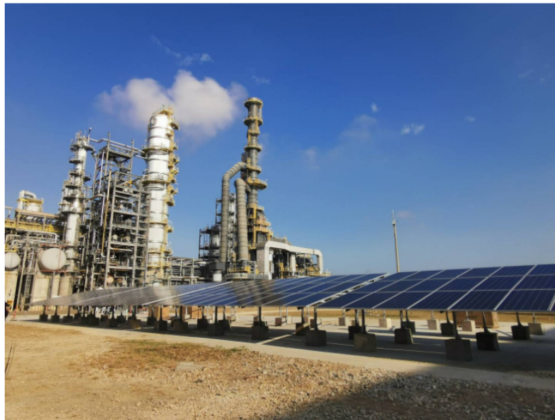
Piloto de hidrógeno verde de Ecopetrol . En marzo, el Grupo Ecopetrol inició la producción de hidrógeno verde con un electrolizador de 50 kilovatios y 270 paneles solares en la refinería de Cartagena.

En el caso colombiano comentó que el piloto va a permitir medir en la práctica los beneficios de esta fuente e identificar los retos que aún existen en áreas como la inversión y la tecnología , por lo que "pasarán unos años antes de que esto sea accesible de verdad y tenga unos valores que permitan la conversión o la introducción" de esta solución.