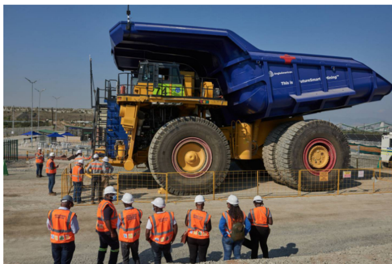
Hidrógeno verde Un camión impulsado por hidrógeno, que forma parte del proyecto NuGen de Anglo American Plc para la neutralidad del carbono, en la mina de platino de Anglo American Platinum Ltd en Mogalakwena, Sudáfrica, el viernes 6 de mayo de 2022.

Colombia apuesta por el hidrógeno verde para tener una movilidad más limpia, por lo que las empresas avanzan en alianzas y pilotos para alcanzar las metas