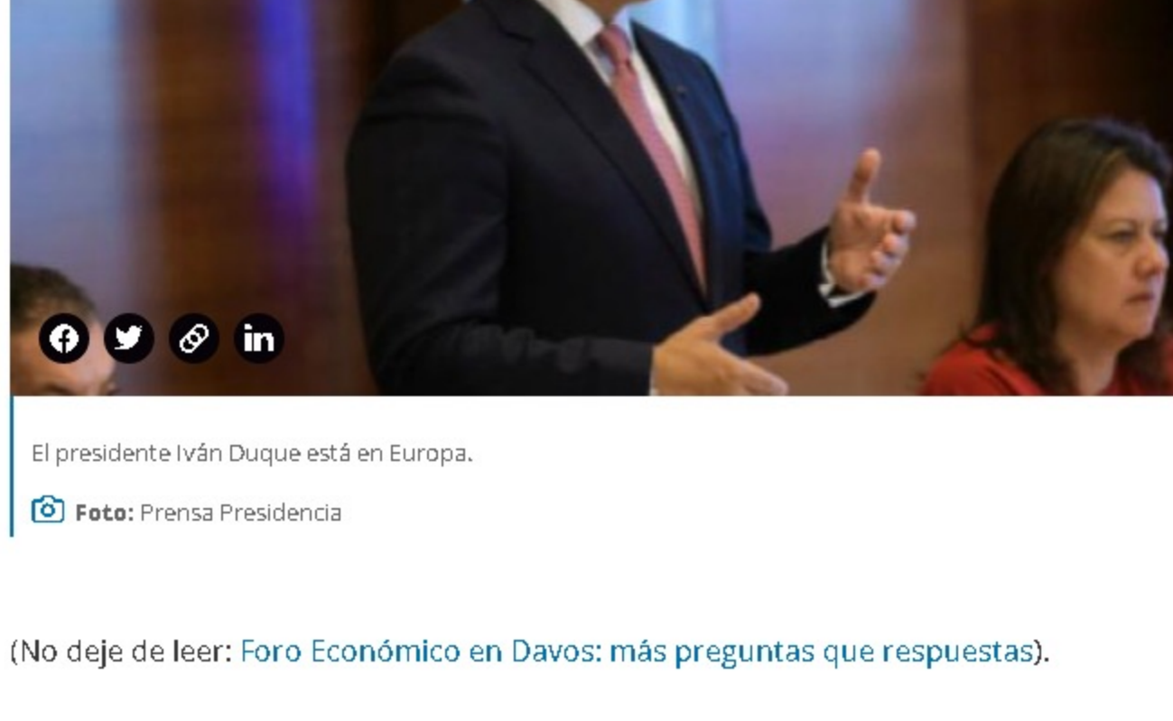
El presidente Iván Duque está en Europa.

Y en lo que atañe a los gobiernos, ocurre algo similar. Así como en su momento lo hicieron Álvaro Uribe o Juan Manuel Santos, Iván Duque entiende la importancia de la cita global.