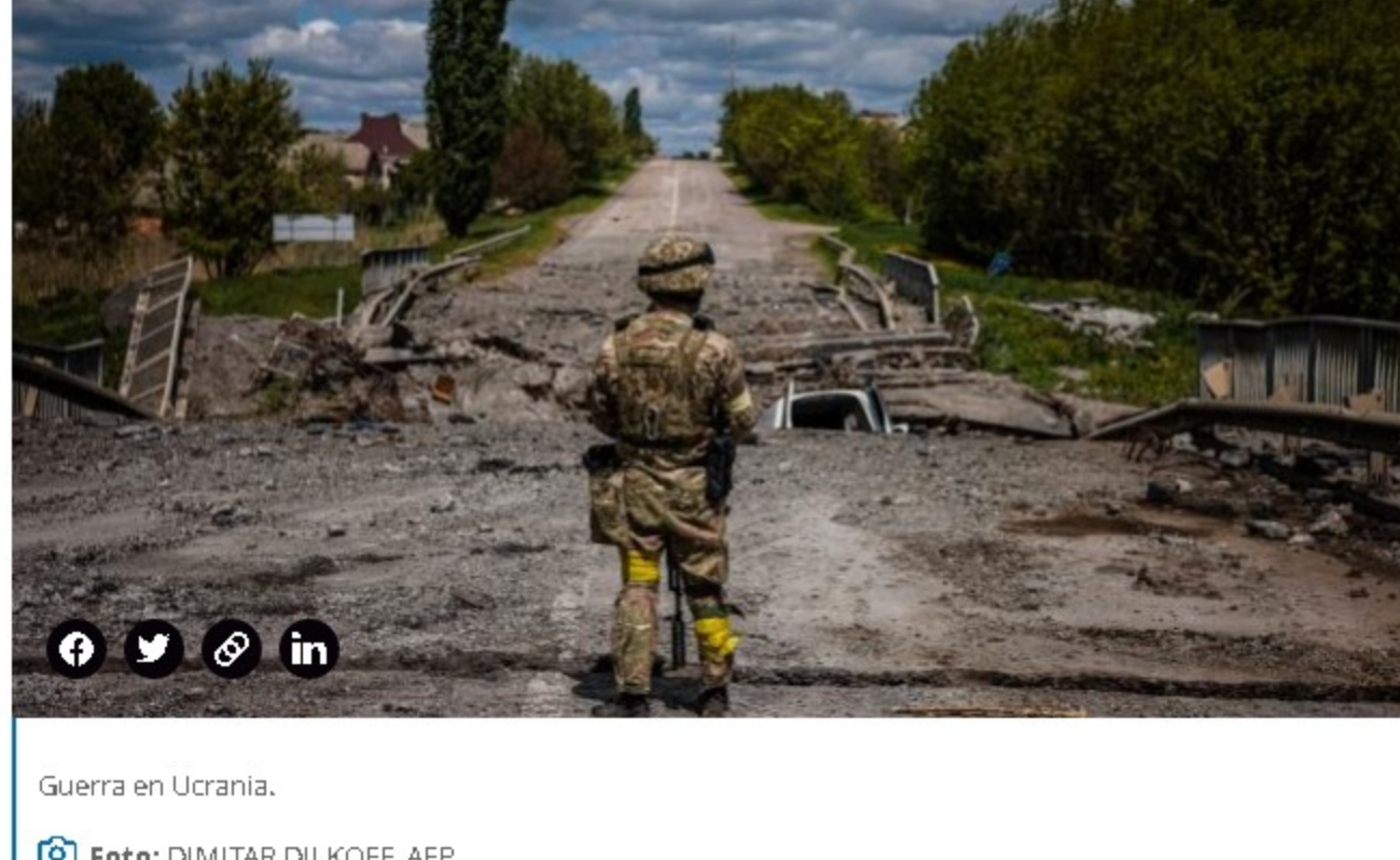
Guerra en Ucrania.

(Además: Seguro para el agro: lento inicio, pese a riesgos y subsidios).