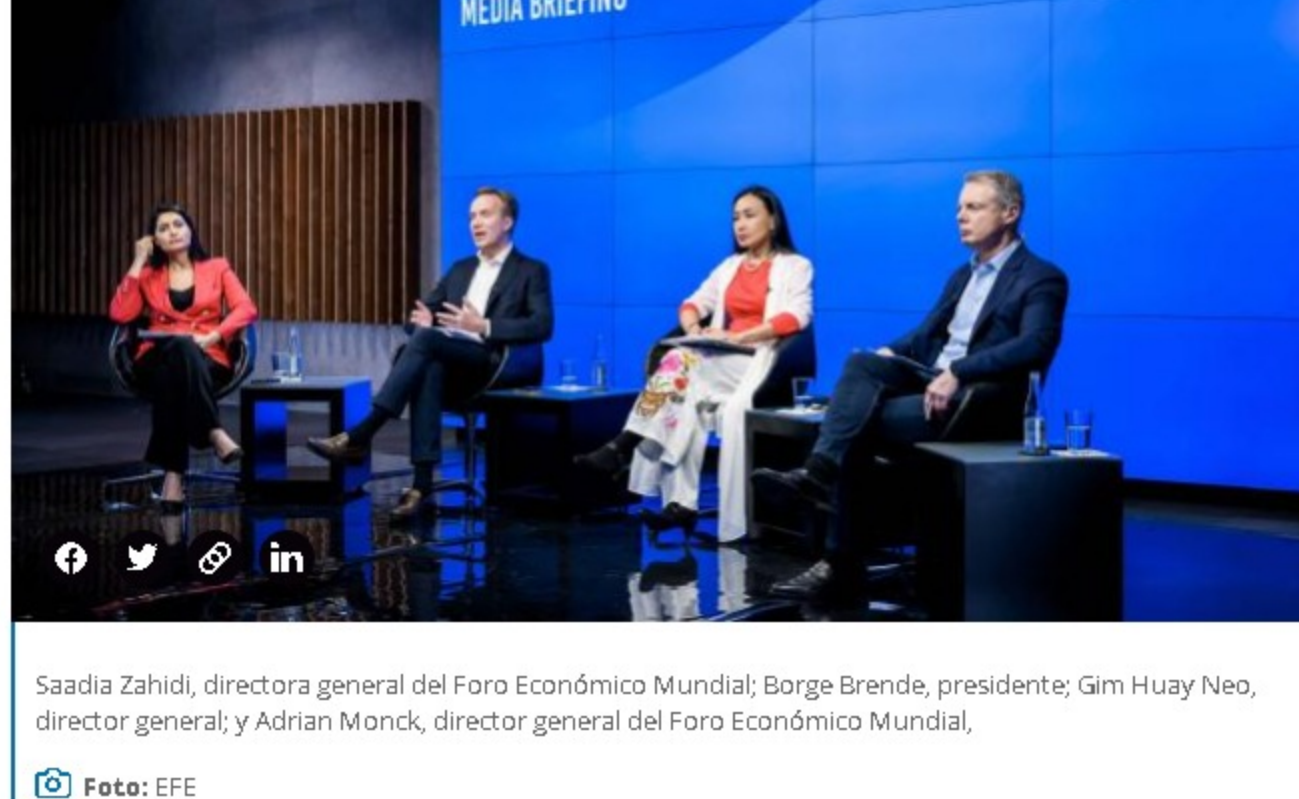
Saadia Zahidi, directora general del Foro Económico Mundial; Borge Brende, presidente; Gim Huay Nio, director general; y Adrian Monck, director general del Foro Económico Mundial.

Como resultado, los gobiernos más endeudados tendrán que dedicarle una tajada más grande del presupuesto a la deuda pública, que creció significativamente para mitigar los efectos de la pandemia