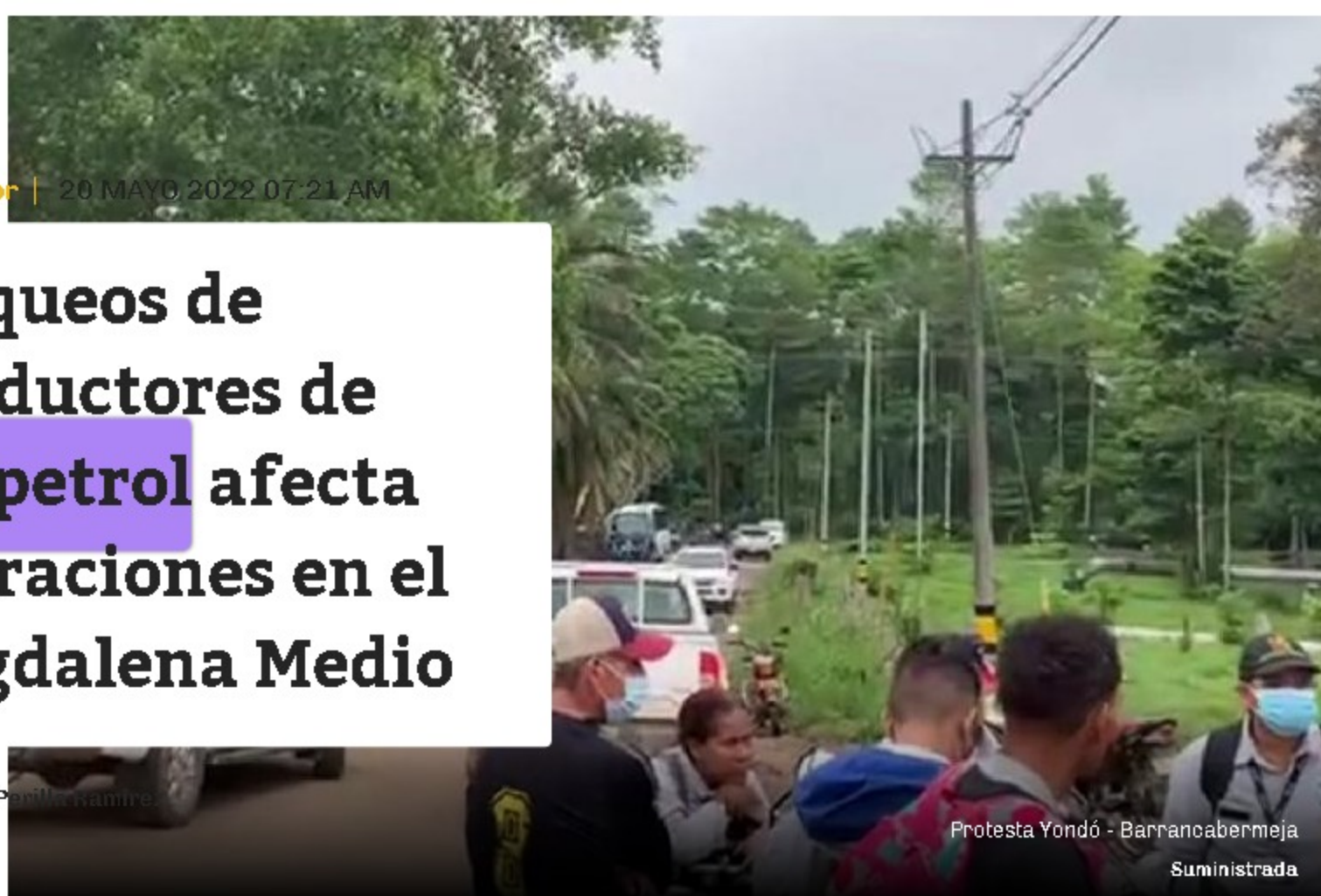
Protesta Yondó - Barrancabermeja

Estas protestas afectan a más de 590 contratistas y trabajadores directos en las áreas de Casabe Sur y Peñas Blanca.