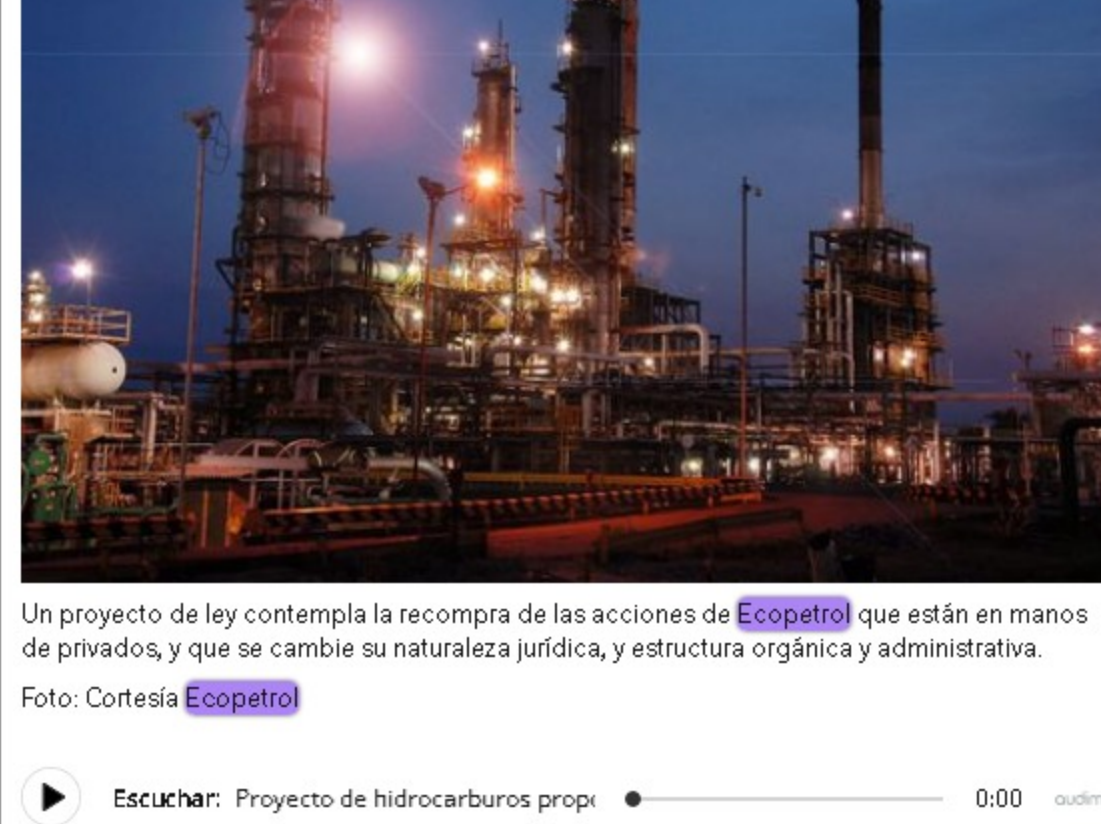
Un proyecto de ley contempla la recompra de las acciones de Ecopetrol que están en manos de privados, y que se cambie su naturaleza jurídica, y estructura orgánica y administrativa.

Escuchar: Proyecto de hidrocarburos propi 0:00 audímo