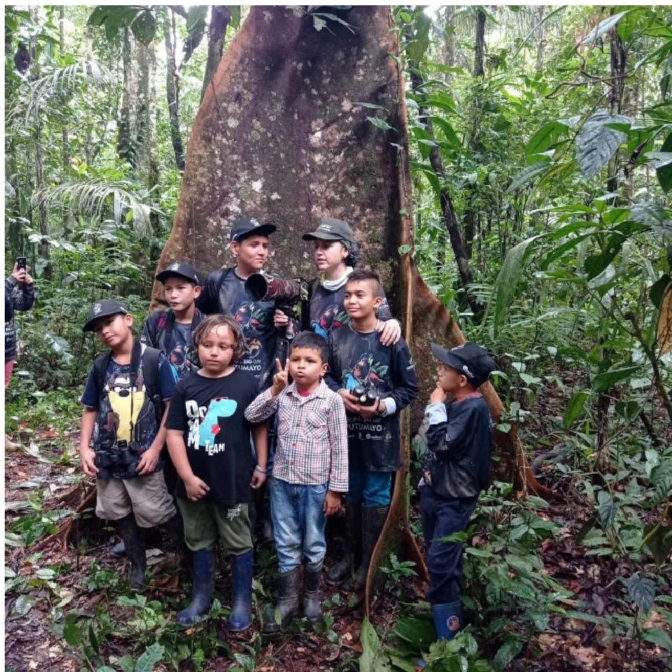
los niños fueron protagonistas en el Global Big Day Putumayo.

Más de 300 personas participaron desde el departamento del Putumayo en el Global Big Day (Gran Día Mundial) el evento más importante del planeta en observación de aves, actividad Promovida por la Universidad de Cornell, New York, que consiste en salir a observar la avifauna de cada país y región del mundo durante 24 horas para subir los listados a la plataforma digital www.ebird.org , que es donde se consolida toda la información.