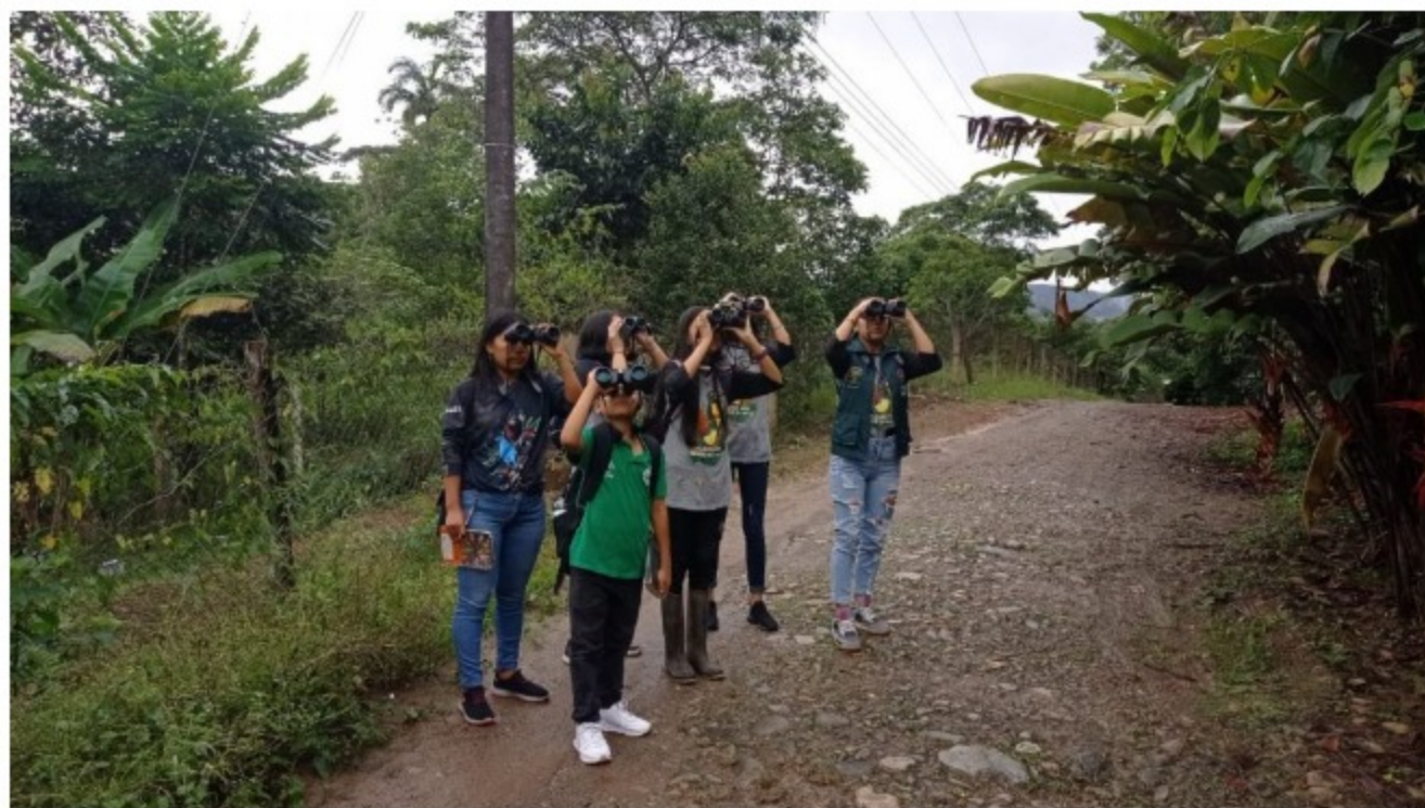
La participación de Putumayo contó con más de 300 personas. Es la más alta hasta la fecha.

Gracias a esta salida de campo de 24 horas, apoyada por la gobernación del Putumayo, Amerisur, Ecopetrol, Geopark, y otras 40 organizaciones, se pudo detectar, Según los resultados parciales de la plataforma Ebird, 482 especies de aves en Putumayo, 166 listas de aves completas, 138 sitios de interés para la observación, lo que ubica temporalmente al departamento en el puesto 5 en relación con Colombia. Los datos se siguen sumando con las listas de pajareros que por la lejanía de sus rutas aún no han cargado la información o porque se encuentran en el proceso de identificación de las especies.