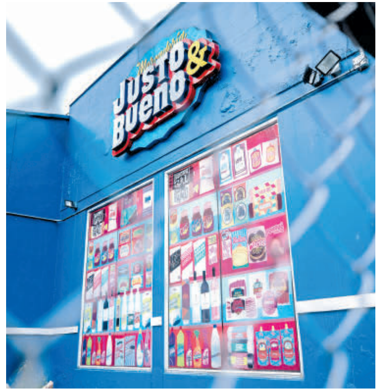
Mercadería S.A.S. no tiene recursos para pagar sus deudas, en la liquidación podrían rematar sus bienes.