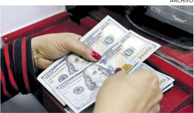
La tasa de referencia actual es de $4.109,71.

El miniminas destacó el potencial que tiene la ciudad de ser un gran hub de servicios y bienes para la industria petrolera, no solamente en los proyectos que se están desarrollando y que se van a desarrollar en el departamento, sino en costa afuera en la región