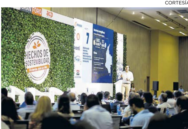
El ministro de Minas y Energía, Diego Mesa.

BARRANQUILLA ES UN HUB. Por su parte, el ministro de Minas y Energía, Diego Mesa Puyo, aseguró que Barranquilla tiene 5.432,95 hectáreas dispuestas para exploración y producción de hidrocarburos, y que actualmente están en fase de exploración.