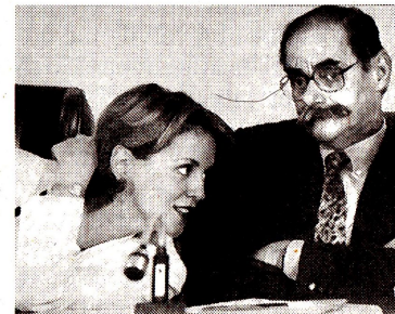
Los ministros Mejía y Serpa.

Tras cinco horas de debate, la Comisión Primera del Senado aprobó el proyecto para revivir la extradición de nacionales. La extradición quedó condicionada a la no retroactividad, a los tratados públicos y a que los delincuentes que se sometan a la justicia no puedan ser entregados al país que los requiera. En la foto, los ministros Horacio Serpa y María Emma Mejía, satisfechos por el deber cumplido de la primera prueba.