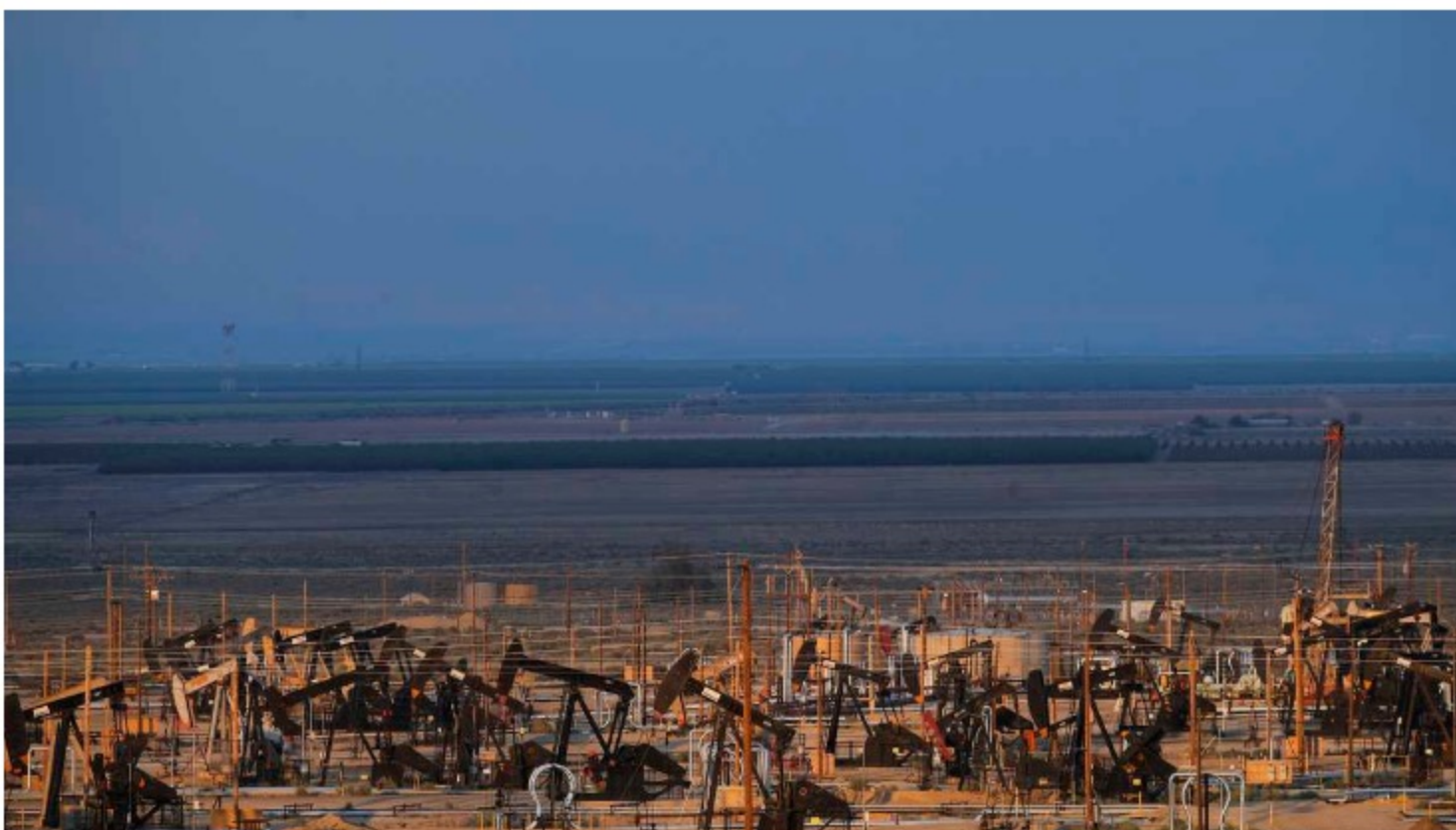
La técnica de fracking ha sido ampliamente criticada por movimientos ambientales.