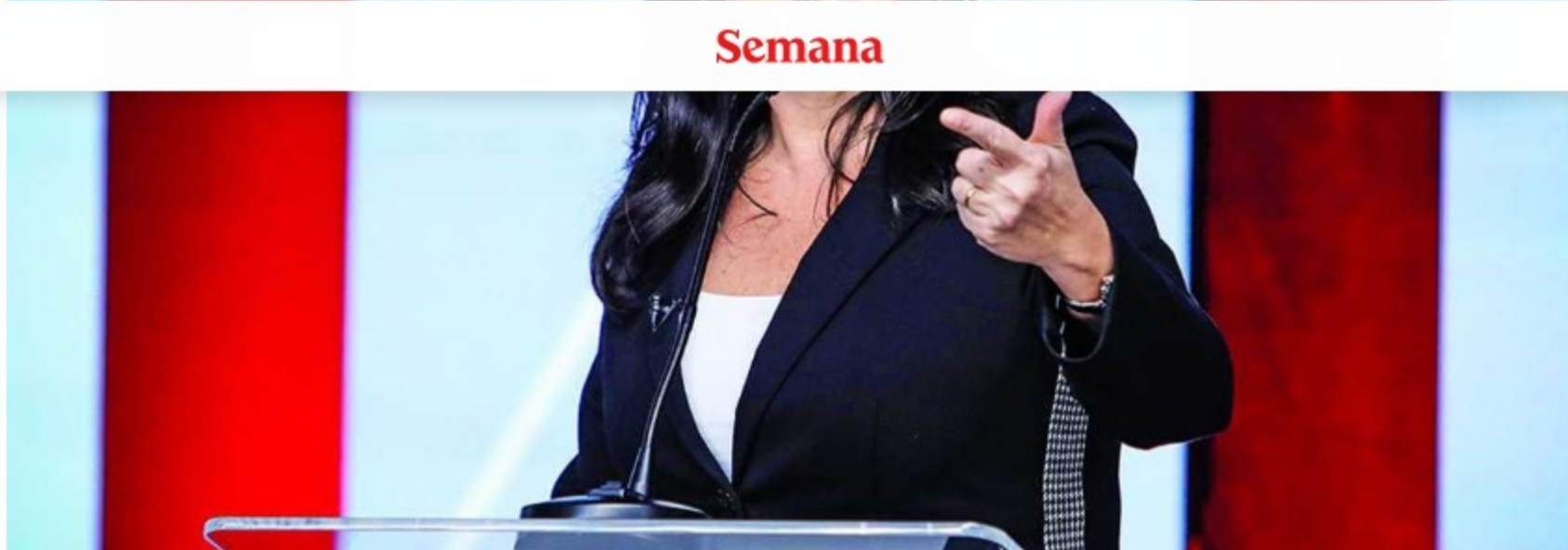
María Fernanda Cabal.

En su cuenta de Twitter, la senadora María Fernanda Cabal citó el proyecto de Ley 459 de 2022, radicado en Cámara de Representantes. A su vez, hizo fuertes críticas a su contenido, anticipando que -de ser aprobado- puede ser "peligroso".