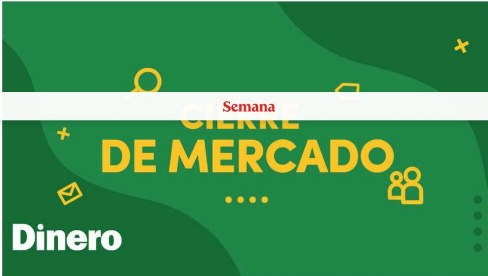
El principal índice de la BVC se desvalorizó un 0,18 % hasta las 1.509,00 unidades.

El índice MSCI Colcap de la Bolsa de Valores de Colombia finalizó la jornada de este miércoles con pérdidas. De esta forma, el principal índice de la BVC se desvalorizó un 0,18 % hasta las 1.509,00 unidades, lastrado por las acciones del sector asegurador.