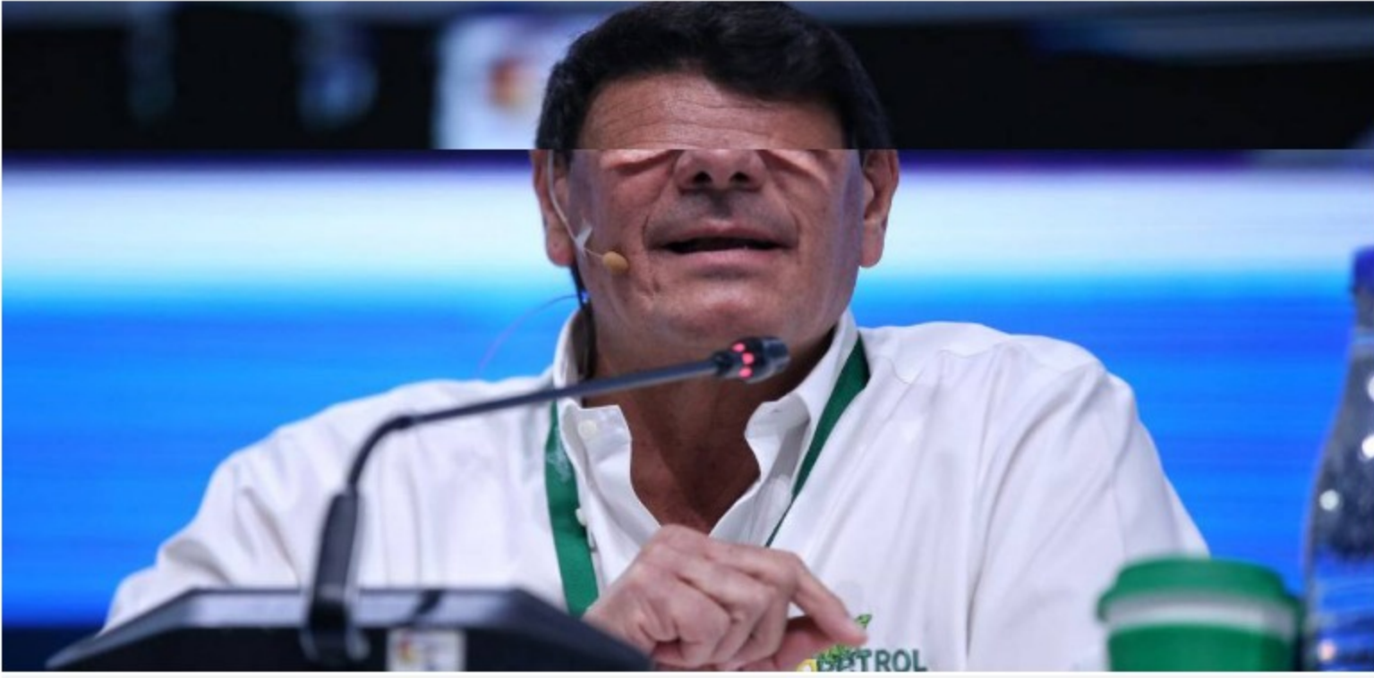
Ganancias de Ecopetrol

En el periodo enero-marzo, los ingresos del grupo alcanzaron los $ 32.5 billones.