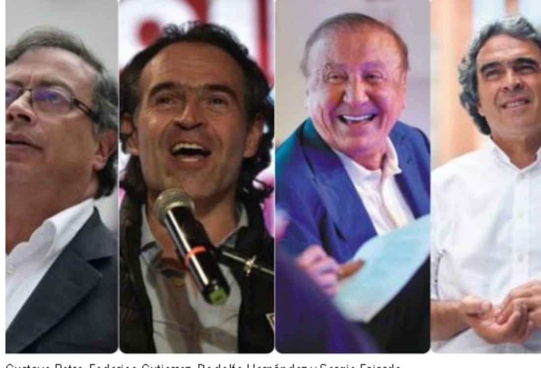
Gustavo Petro, Federico Gutierrez, Rodolfo Hernández y Sergio Fajardo.